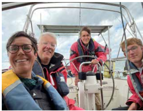
Bijna weer thuis met de hele Familie

De wind wordt steeds zwakker en de stroom loopt mooi mee. Op het eind van de Banjaard trekt de wind plotseling weer aan, van 5 tot 25 knopen, waardoor we met een goede gang op de genua richting Roompotsluis stuiven. De sluis kunnen we vlot passeren; met onze 19.5 meter masthoogte gaat het wel krap, maar volgens de sluiswachter kan het prima.