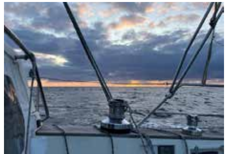
Zonsondergang op de Noordzee

Vandaag staat er voor Stavanger een zuidenwind van 25 knopen - dus uit de verkeerde hoek en te hard. Onze zoon Douwe komt vandaag aan, hij kan nog een dagje in Stavanger kijken. Vrijdag lijkt het beter weer te worden: ten noorden van ons geldt een waarschuwing voor 7 bft, maar naar het zuiden is de wind de komende 3 à 4 dagen veel zwakker (ZW 5-15 knopen). Uit het noorden komt er dan wel weer meer wind, maar daar blijven we in principe zuidwaarts van. Niet ideaal, maar wel te doen en veilig. We besluiten om vrijdag vroeg naar Terschelling te vertrekken. Dan zal de wind voldoende zijn afgenomen. We zullen aan de wind over bakboord moeten varen. Afhankelijk van de dan actuele wind komen we ergens tussen het Duitse wad en Den Helder uit, maar dat