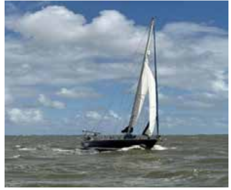
Bokkig op de Boontjes

Vandaag is het niet veel beter, geen weer om over de Noordzee naar Burghsluis te gaan. Daarom besluiten we via het Wad en IJsselmeer te varen, en daarna bij IJmuiden weer de zee op te gaan. De wind staat W6. Met twee riffen en de kotterfok varen we over het Wad. Het gaat heerlijk. De sluis bij Kornwerderzand is tijdelijk buiten werking vanwege de hoge waterstand. Maar als we bij de sluis zijn, draait hij net weer en kunnen we vlot schutten. Nu op naar Enkhuizen over een knobbelig IJsselmeer.